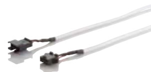
1x 10 meters 4-wire connection cable for doorbell with camera