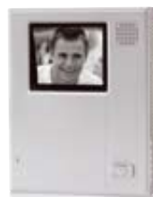
1x Hands free monitor including wall bracket